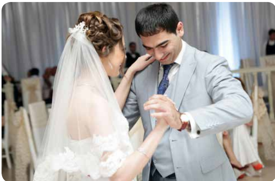
Photo d'un couple prise le jour de leur mariage, gracieuseté de Wikimedia Commons

Du point de vue juridique, le consentement est un sujet très vaste. Nous tenterons ici d'en expliquer quelques importantes caractéristiques. Le consentement est un acte humain qui ne peut provenir que de la volonté et il est impossible d'y substituer de quelque façon. Rien ne peut le remplacer. Il appartient à la personne seule. « L'objet » du consentement est le don de soi de l'époux, de l'épouse, l'un envers l'autre, dans le but de former et de vivre une alliance d'amour fidèle et fécond. La tâche propre de la volonté est d'obtenir cet acte de consentement librement exprimé; il ne peut s'agir que d'une seule pensée dans la tête de la personne. Le consentement doit se manifester extérieurement. Il s'agit d'un consentement – pas deux – nous rappelant l'unité de l'alliance, bien que deux personnes, un homme et une femme vont s'échanger mutuellement cet acte consensuel.