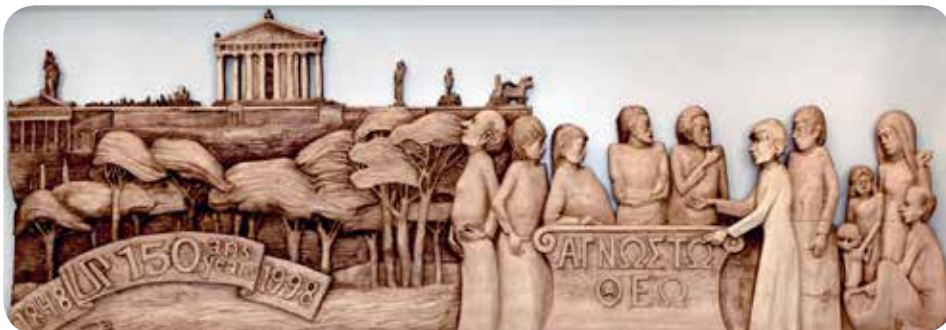
Saint Paul enseigne à Athènes, en haut de l'entrée à l'Université Saint-Paul, gracieuseté du père Herman Falke

Bien qu'il ait pris sa retraite en 2010, à l'âge de 82 ans, il exerce toujours son art de peintre et de sculpteur.