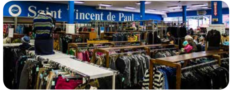
Le département de vêtements, ainsi que la vitrine de la Saint-Vincent de Paul.

À Ottawa, le magasin de la SSVP est situé au 1273, rue Wellington Ouest. Un personnel généreux et bienveillant