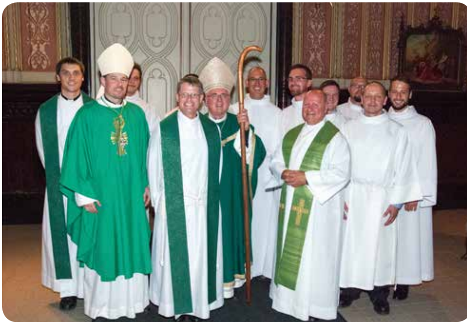
Photo prise lors de la messe pour les séminaristes à la cathédrale Notre-Dame le 30 août 2014, gracieuseté de Heribert Riesbeck

avec Les équipes NET . Il a ensuite entamé des études au séminaire St. Augustine. Il est actuellement assistant-curé à la paroisse Holy Redeemer à Kanata.