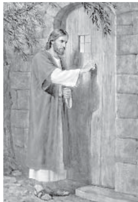
Jésus cogne à la porte de notre coeur et c'est à nous de l'ouvrir. Gracieuseté de Del Parson

vicaire épiscopal, au 613-738-5025, poste 259 ou par courriel : dberniquez@archottawa.ca .