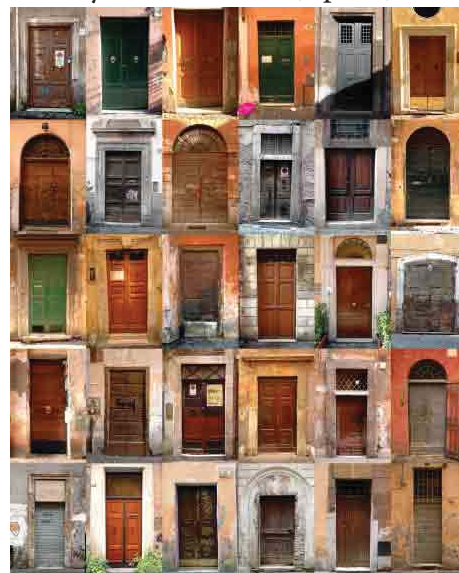
Portes (Rome, Italie)

nous dit avoir vu une porte ouverte dans le ciel qui lui permit d'accéder aux mystères de Dieu (Ap 4,1).