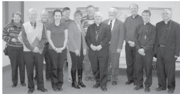
Le Conseil d'administration de l'archidiocèse d'Ottawa soutient les initiatives qui visent à prendre soin de la Création de Dieu.

Nous participons au Virage vert des lieux sacrés , programme qui cherche à encourager et à aider les paroisses à devenir de véritables lieux d'intendance à l'égard de la création. Nous organisons des ateliers de temps à autre sur les nouvelles pratiques écologiques, et nous pouvons vous renseigner en tout temps sur les ressources disponibles. Pour en connaître davantage sur nos services, rendez-vous à la rubrique Intendance environnementale qui se trouve sous la section Pastorale sur le site web de l'archidiocèse : www.CatholiqueOttawa.ca .