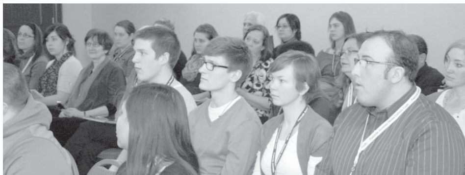
Photo prise lors d'un atelier à la conférence du Réseau canadien des responsables de la pastorale jeunesse à Ottawa

L'Église canadienne a prévu pour l'année qui vient un programme et une série d'activités pour soutenir les familles dans leur mission de foi et renouveler ainsi la foi chrétienne dans notre pays.