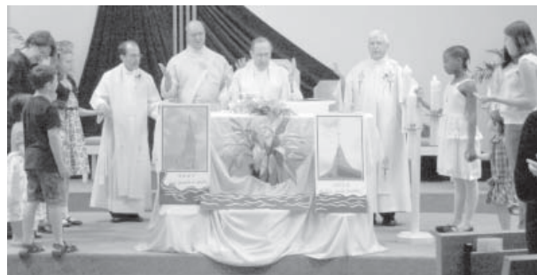
La messe à Notre-Dame-de-Lourdes

Un livre souvenir a été publié pour raconter la vie de la communauté et des familles de la paroisse. Il est actuellement en vente. La fête de la Saint-Jean-Baptiste en juin et la fête du houblon en septembre sont les grands événements rassembleurs du centenaire de même que la messe solennelle présidée par Mgr Terrence Prendergast, s.j.