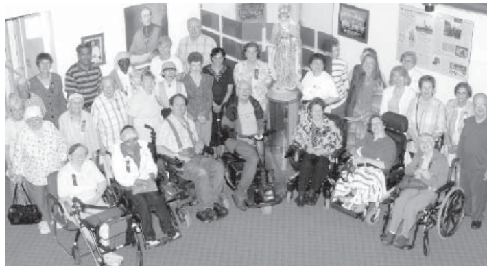
Le pèlerinage annuel pour les personnes handicapées au Cap-de-la-Madeleine organisé par la Légion de Marie

Si vous voulez aider un ministère ou une paroisse avec une police d'assurance vie ou un legs, veuillez communiquer avec moi à lmorton@archottawa.ca ou au 613-738-5025, poste 235.