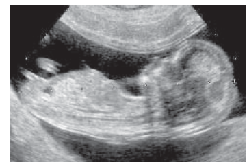
Un embryon à 12 semaines

Les prochaines sessions auront lieu le 9 juillet et le 13 août au 151, avenue Holland. D'autres dates et lieux suivront. Pour fixer un rendez-vous, veuillez envoyer un courriel à : ontario@serena.ca ou composez le 613-728-6536. Pour plus d'information, visitez www.serena.ca .