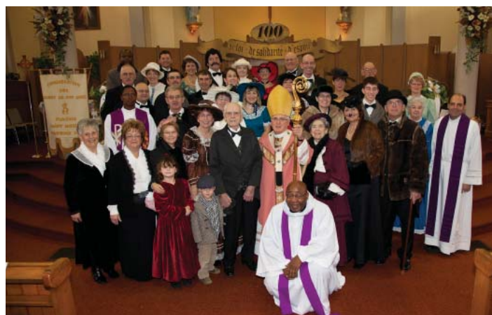
Photo prise lors de la messe d'ouverture le 11 déc. 2011.

Plusieurs activités ont été organisées pour fêter le centième anniversaire de cette communauté toujours en pleine croissance : une conférence donnée par la professeure Élisabeth Lacelle sur le thème Croire aujourd'hui , suivie d'un vin fromage le 20 avril dernier ; un souper de barbotes préparé par