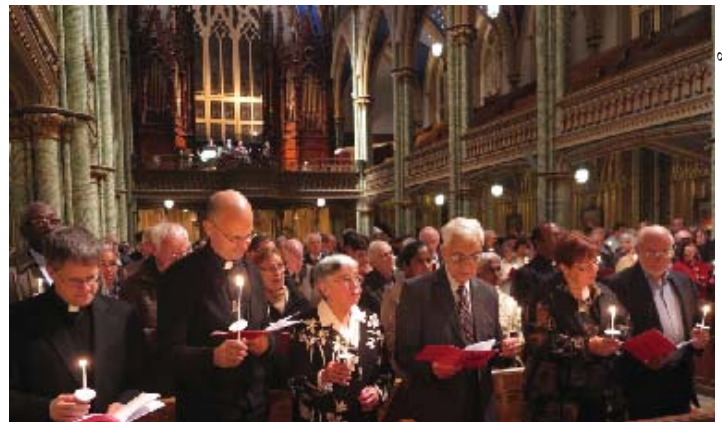
La célébration de la Parole le 11 octobre dernier pour l'ouverture de l'année de la foi.

Le lundi 22 octobre, nous avons participé à la messe d'action de grâces présidée par le président de la Conférence des évêques catholiques du Canada, (Voir la suite à la page 2)