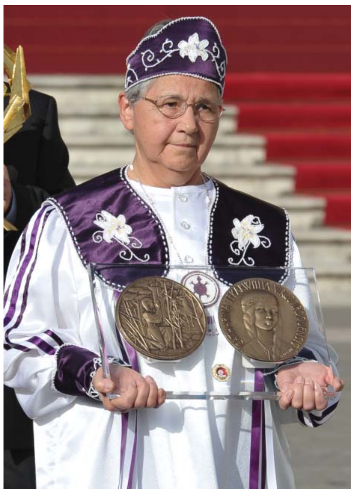
Photo prise lors de la cérémonie de la canonisation de la bienheureuse Kateri Tekakwitha le dimanche 21 octobre 2012 à 10h en la Place Saint-Pierre.