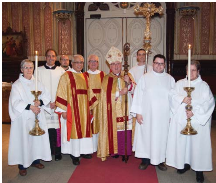
Célébration de l'ouverture de l'Année de la foi à la cathédrale Notre-Dame le 11 octobre 2012.

Forts de notre confiance en Dieu et en nous-mêmes, tournons-nous vers les Saintes Écritures, vers les enseignements de l'Église, vers les appels au partage et au respect de tous que nous livrent nos pasteurs ainsi que les personnes qui ont marqué notre temps, catholiques et non-catholiques, les Mère Theresa, Oscar Romero, Martin Luther King, Nelson Mandela, Shahbaz Bhatti, et bien d'autres (parents, voisins, amis) qui ont donné ou qui donnent encore de leur temps pour faire avancer la cause de l'amour, du pardon et de la compréhension, faire naître un sourire chez une personne en détresse ou en difficulté. Oui, nous sommes tous appelés à travailler avec con-