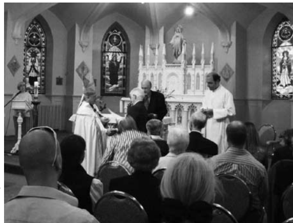
Soirée des vendanges 2009